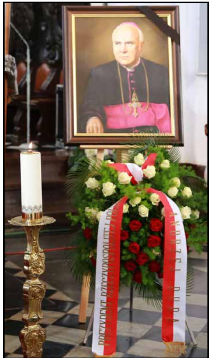
Wieniec od Andrzeja Dudy Prezydenta Rzeczypospolitej Polskiej

Prezydent Rzeczypospolitej Polskiej ANDRZEJ DUDA