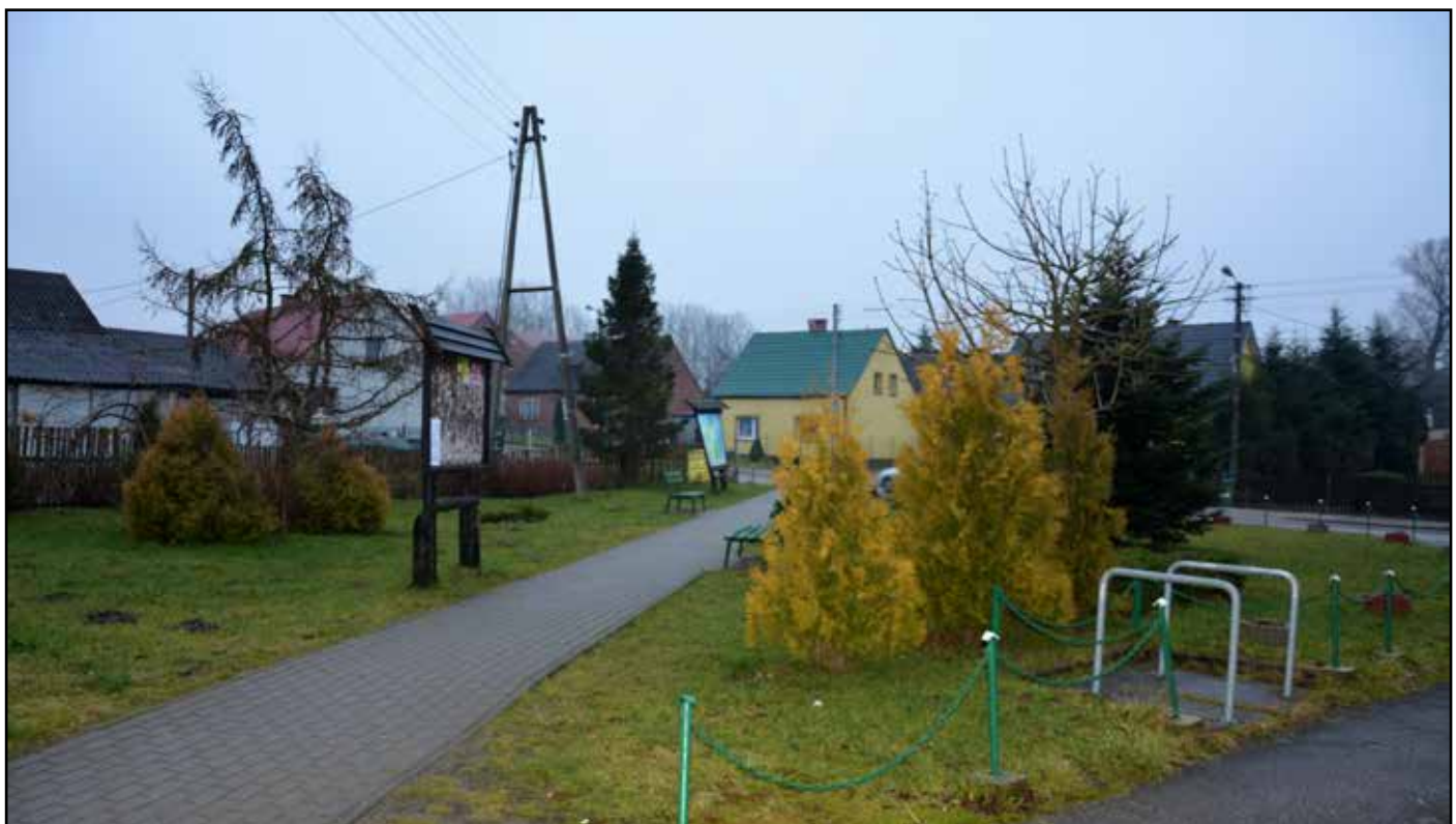
Obecny skwer w pobliżu skrzyżowania ulic Wolności i Kasztanowej w Mierzeszynie. Tu powstanie Pomnik Niepodległości.