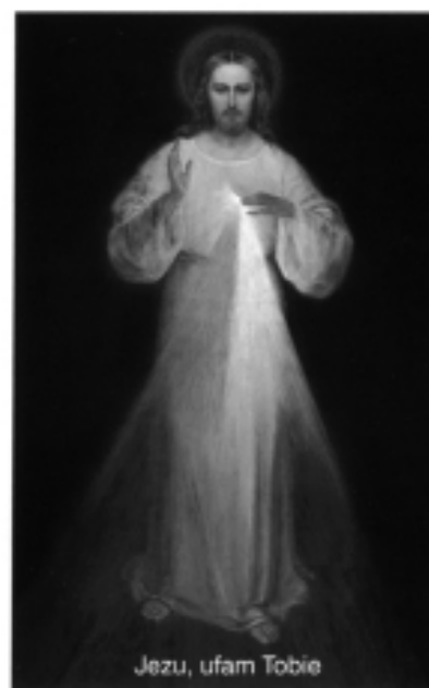
Jezu, ufam Tobie