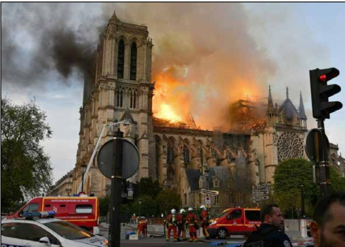
Wielki pożar katedry Notre - Dame de Paris, Wielki Poniedziałek, 15 kwietnia 2019 roku

STRONA INTERNETOWA NASZEJ PARAFII: www.parafia.i3k.pl