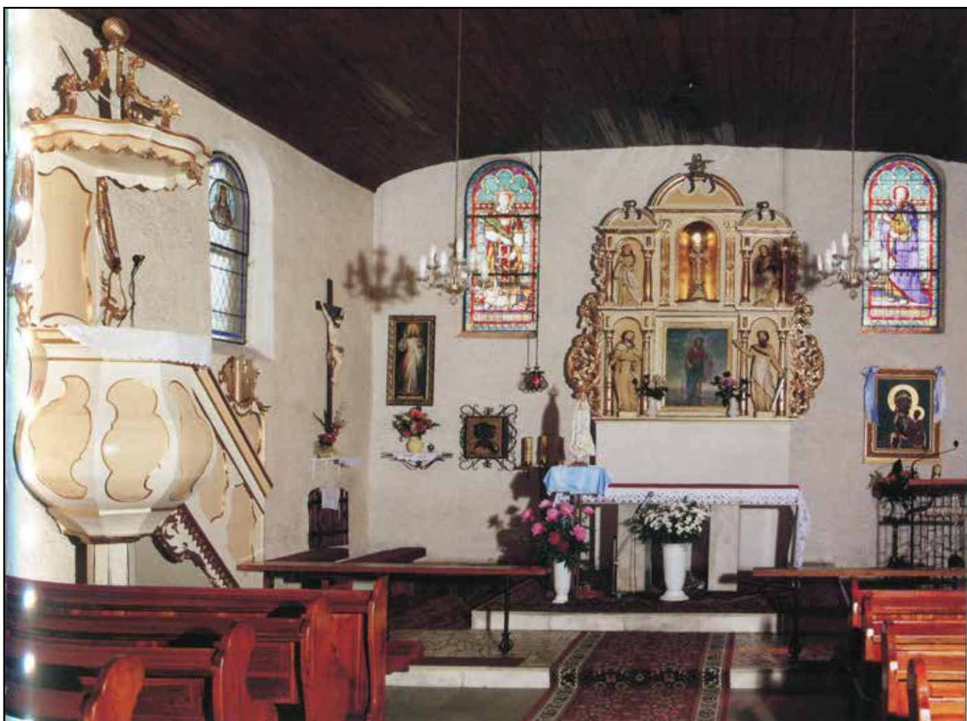
Prezbiterium kościoła parafialnego św. Bartłomieja Apostoła w Mierzeszynie, stan z maja 2008 roku

ZAPRASZAMY NA UROCZYSTOŚCI ODPUSTOWE KU CZCI ŚWIĘTEGO BARTŁOMIEJA APOSTOŁA DO MIERZESZYNA, 25 SIERPNIĄ 2019 ROKU