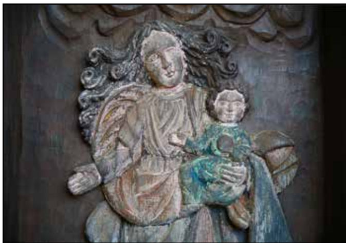
Matka Boża Bartłomiejowa z Mierzeszyna (fragment; stan pierwotny przed renowacją, 16 lipca 2019 roku)