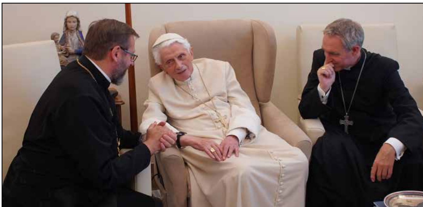
Watykan, 10 września 2019 roku, klasztor Mater Ecclesia . Od lewej: Ks. Arcybiskup Swiatosław Szewczuk zwierzchnik Ukraińskiego Kościoła Greckokatolickiego - arcybiskup większy kijowsko-halicki, Ojciec Święty Benedykt XVI oraz Ks. Arcybiskup Georg Gänswein osobisty sekretarz Benedykta XVI.

Papież-senior wręczył swym gościom medal pamiątkowy, wybity z okazji jego wizyty w Ziemi Świętej [w maju 2009]. Synod Biskupów UKGK zebrał się w dniach 1-10 września 2019 roku w rzymskim Kolegium św. Jozafata, a stolicę Włoch wybrano nieprzypadkowo ze względu na główny temat obrad, związany z jednością w życiu i posłudze Kościoła. Całe wydarzenie rozpoczęło się uroczystą świętą liturgią biskupią we wspomnianym soborze Świętej Sofii, obchodzącym w tym roku 50. rocznicę konsekracji. 2 września 2019 roku ukraińskich biskupów grekokatolickich przyjął Franciszek, a po zakończeniu obrad, 10 września 2019 roku odbyło się spotkanie z Papieżem-seniorom.