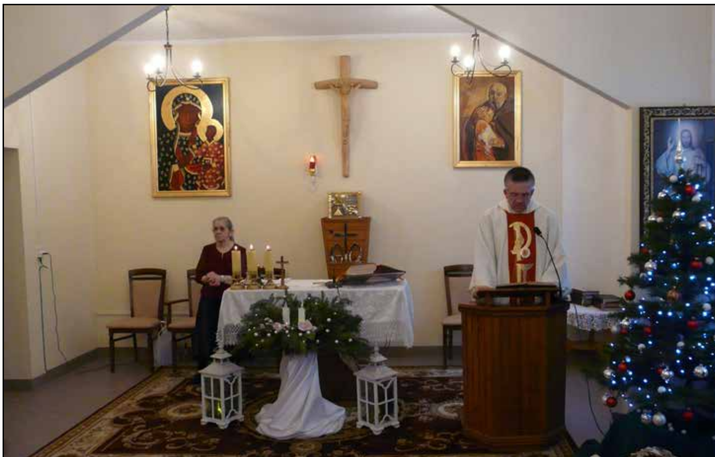
Wigilia Bożego Narodzenia w Domu Pomocy Społecznej „Leśny” w Zaskoczynie 22 grudnia 2023 roku