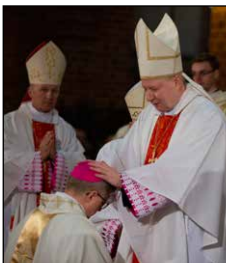
- przez Ks. Biskupa Wiesława Szlachetkę Biskupa Pomocniczego Archidiecezji Gdańskiej;