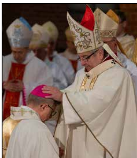
- przez Ks. Arcybiskupa Sławoja Leszka Głódzia Metropolite Gdańskiego;