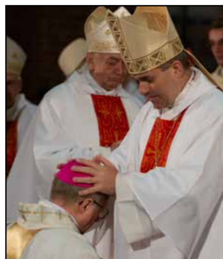
- przez Ks. Biskupa Zbigniewa Zielińskiego Biskupa Pomocniczego Archidiecezji Gdańskiej.