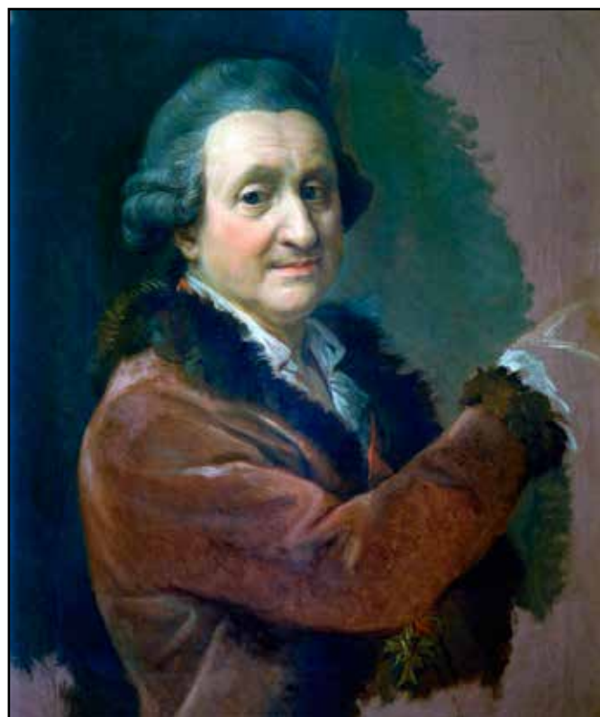
Pompeo Batoni - autoportret