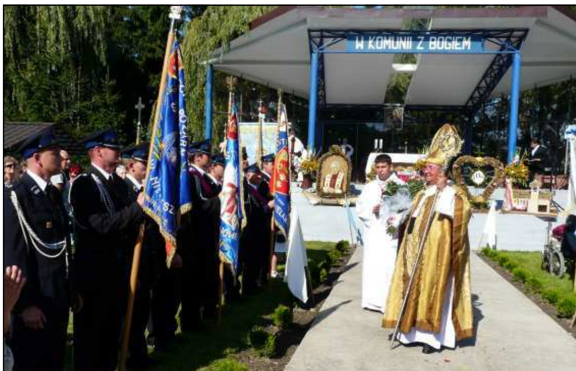
Ks. Arcybiskup pozdrawia strażaków z Ochotniczej Straży Pożarnej Mierzeszyn

STRONA INTERNETOWA NASZEJ PARAFII: www.parafia.i3k.pl