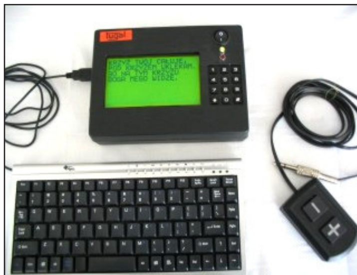
Cyfrowy rzutnik tekstu CRT-20 - komputer

Tytuły i teksty pieśni wpisuje się do cyfrowego rzutnika CRT-20, jak już wspomniano, za pomocą dołączonej klawiatury. W czasie odtwarzania utworu na ekranie rzutnika pokazuje się tytuł i tekst pieśni. Możemy odtwarzać pojedyncze utwory, jak również ułożone wcześniej całe ich zestawy. W tym przypadku po naciśnięciu pilota (ręką lub stopą), odtwarzany jest pierwszy utwór, po czym komputer zatrzymuje się i czeka na