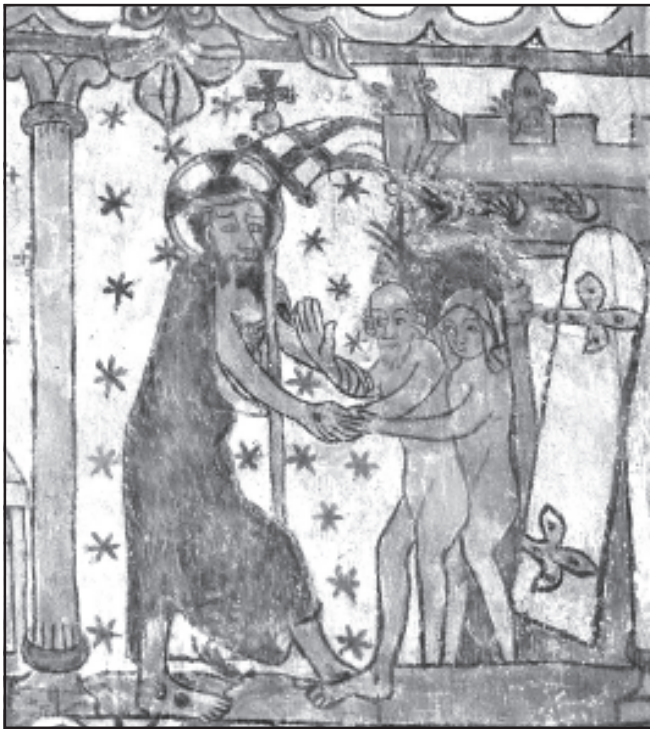
Chrystus wyprowadzający Adama i Ewę z otchłani (fresk)

Starożytna homilia na Świętą i Wielką Sobotę