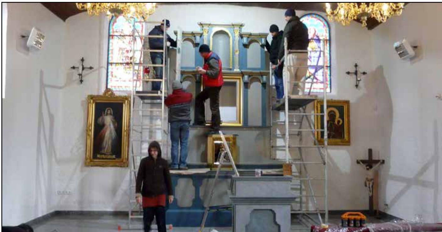
Prace rekonstrukcyjne w prezbiterium kościoła św. Bartłomieja Apostoła w Mierzeszynie 19 marca 2016 roku