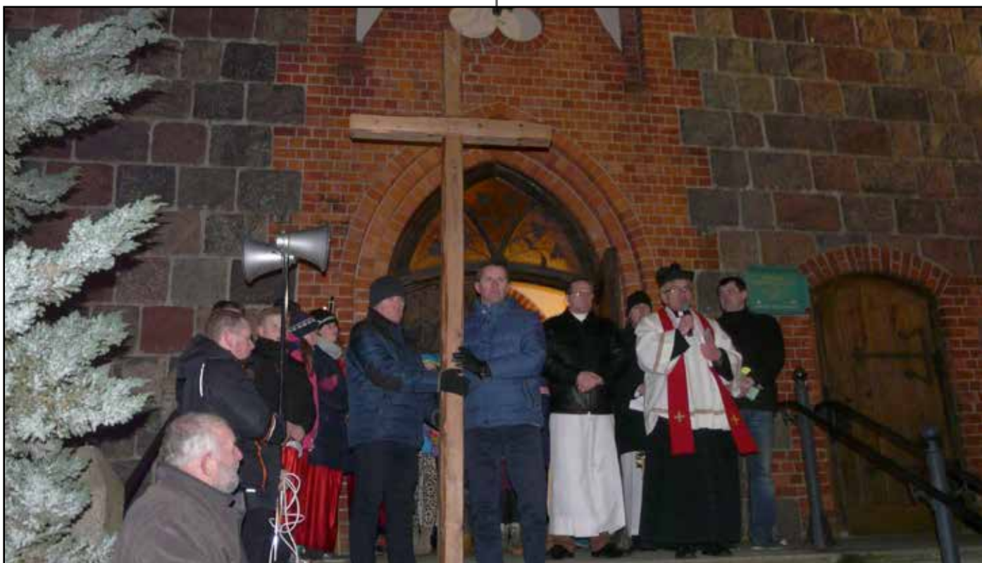
Zakończenie Via Crucis 2016 ulicami Mierzeszyna, 18 marca 2016 roku.