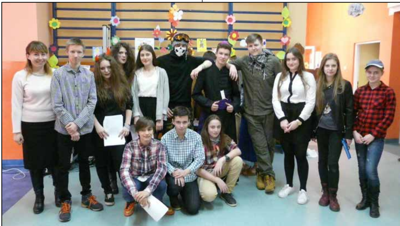
Uczniowie Gimnazjum im. Kazimierza Jagiellończyka w Trąbkach Wielkich przed występem w ramach IX Wojewódzkiego Przeglądu pod hasłem „Misterium Męki i Zmartwychwstania Pańskiego” w Mierzeszynie, 18 marca 2016 roku.