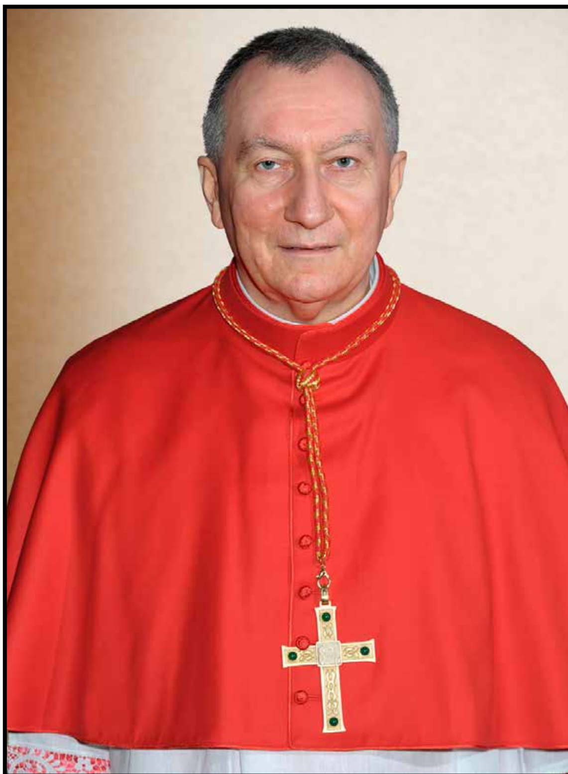
JEGO EMINENCJA KS. KARDYNAŁ PIETRO PAROLIN SEKRETARZ STANU STOLICY APOSTOLSKIEJ