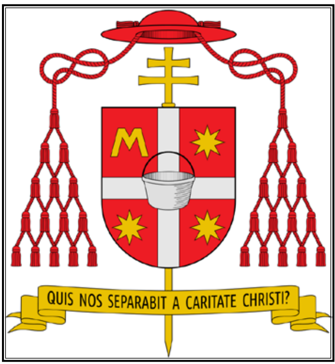
Herb Jego Eminencji Ks. Kardynała Pietro Parolin Sekretarza Stanu Stolicy Apostolskiej (Hasło: „Któż nas może odłączyć od miłości Chrystusowej?”).