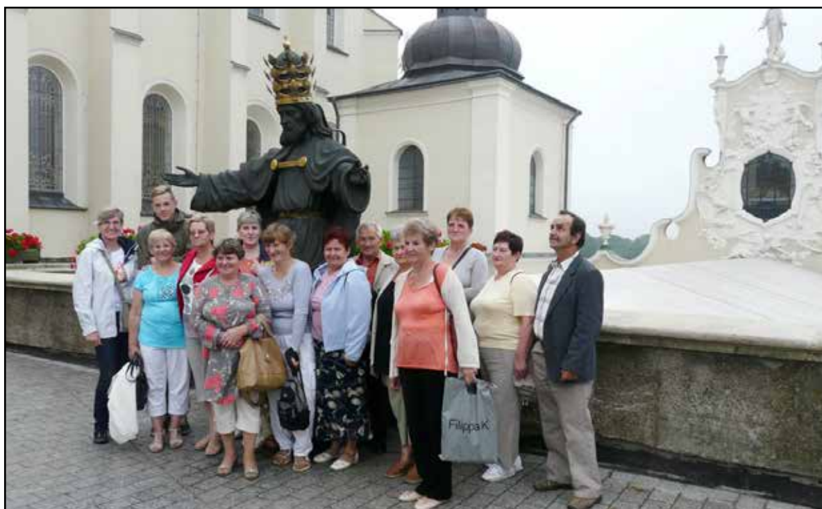
Pielgrzymi z Parafii Mierzeszyn przy figurze Chrystusa Króla na Jasnej Górze, 25.07.2014.

Jezu Chryste, Królu Wszechświata, Panie nasz i Boże, Odkupicielu rodzaju ludzkiego, nasz Zbawicielu! Ty, który mówiłeś, że Królestwo Twoje nie jest z tego świata, który wzywałeś nas do szukania Królestwa Bożego i nauczyłeś nas prosić w modlitwie do Ojca: „ przyjdź Królestwo Twoje ”, wejrzyj na nas stojących przed Twoim Majestatem. Wywyższamy Cię, oddajemy Ci cześć i uwielbienie. Pokornie poddajemy się Twemu Panowaniu i Twemu Prawu. Świadomi naszych win i zniewag zadanych Twemu Sercu przepraszamy za wszelkie nasze grzechy i zaniedbane dobro. Wyrażamy naszą skruchę i prosimy o zmiłowanie. Przymykamy zabiegać o pomnożenie Twojej Chwały, dziękować za nieskończone Miłosierdzie, które okazujesz z pokolenia na pokolenie, wiernością i posłuszeństwem odpowiadać na Twoją Miłość. Boski Królu naszych serc, niech Twój Święty Duch, wspiera nas w realizacji tych zobowiązań, chroni od zła i dokonuje naszego uświęcenia. Niech pomaga nam porządkować całe nasze życie i posłannictwo Kościoła. Króluj nam Chryste! Króluj w naszej Ojczyźnie, króluj w każdym narodzie, na większą chwałę Przenajświętszej Trójcy i dla zbawienia ludzi. Spraw, aby nasze rodziny, wioski, miasta i świat cały objęło Tve Królestwo: królestwo prawdy i życia, królestwo świętości i łaski, królestwo sprawiedliwości, miłości i pokoju, teraz i na wieki wieków Amen.