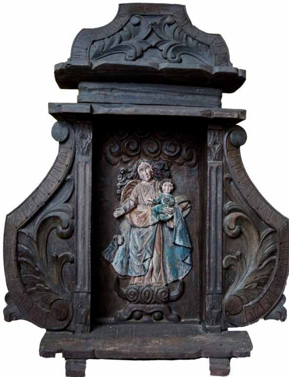
Stan pierwotny wizerunku Matki Bożej. Bawaria XVIII/XIX wiek. Fotografia wykonana 16 lipca 2019 roku.