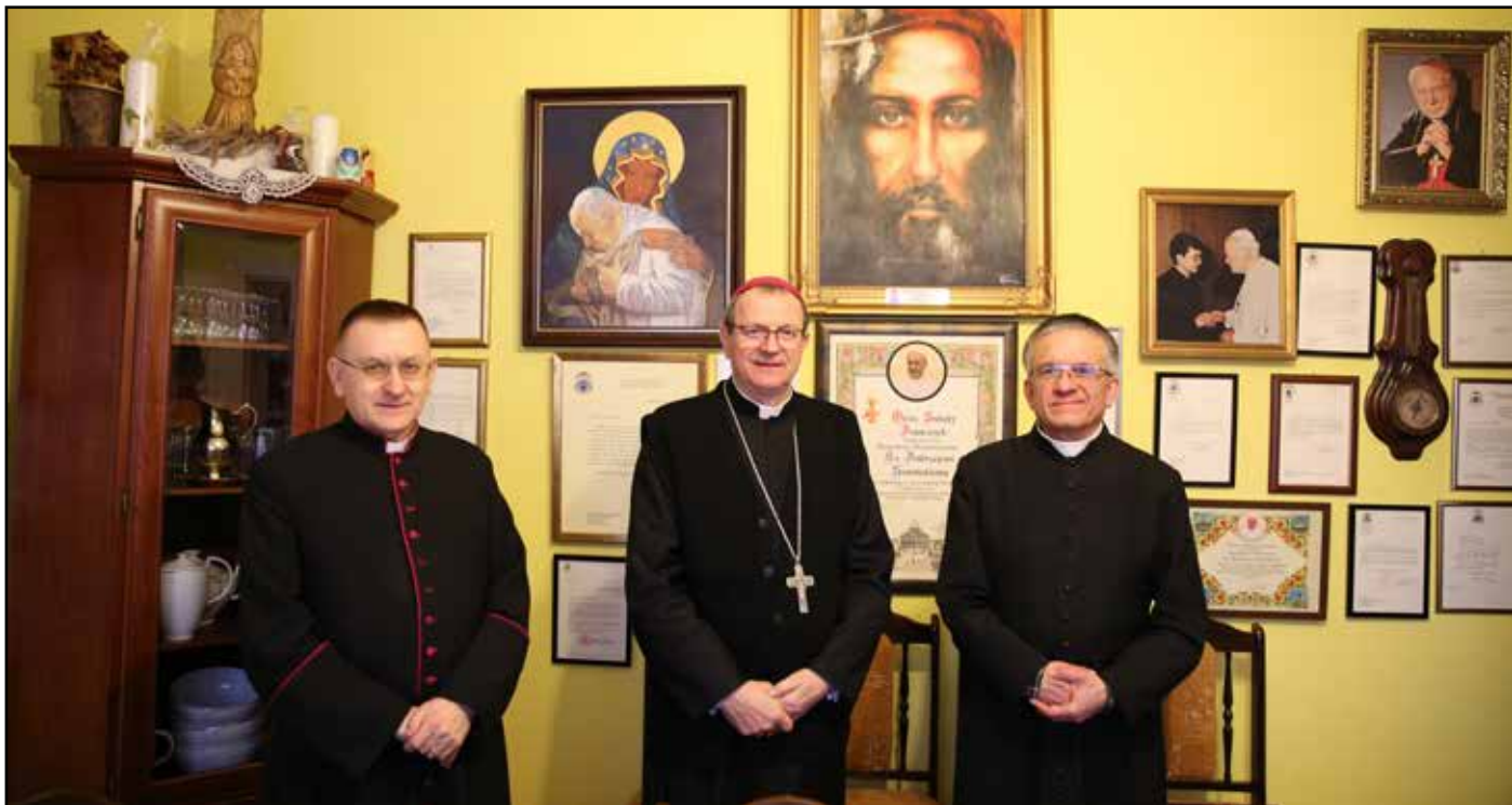
Wizyta duszpasterska kołędu Ks. Arcybiskupa Tadeusza Wojdy SAC Metropolity Gdańskiego w Mierzeszynie 21 stycznia 2023 roku