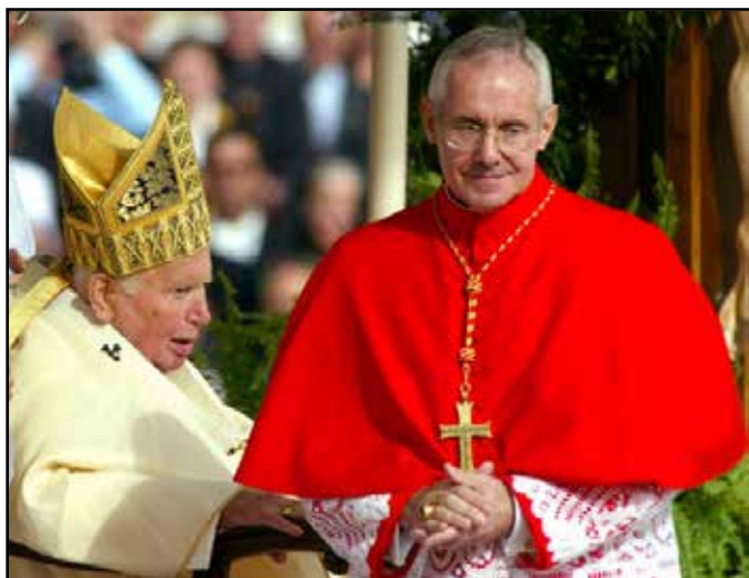
Św. Jan Paweł II i kard. Jean-Louis Tauran

Ojciec Święty Franciszek mianował 20 grudnia 2014 roku kard. Jean-Louis Taurana kamerlingiem, a abp. Giampiero Glodera wicekamerlingiem Świętego Kościoła Rzymskiego. Dotychczas stanowiska te pełnili odpowiednio 80-letni obecnie kard. Tarcisio Bertone oraz niemal 78-letni abp Pier Luigi Celata.